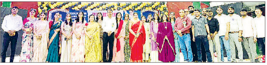
हरिभूमि न्यूज ▶▶ महेन्द्रगढ़

यदुवंशी कॉलेज परिसर में इस वर्ष का विदाई समारोह आयोजित किया गया। समारोह का शीर्षक एक अवसान नया आरंभ रखा गया, जिसने अपने नाम के अनुरूप विद्यार्थियों के जीवन के एक महत्वपूर्ण पड़ाव के समापन और नए सफर की शुरुआत का संदेश दिया। कार्यक्रम की शुरुआत संस्था चेयरमैन एवं पूर्व विधायक राव