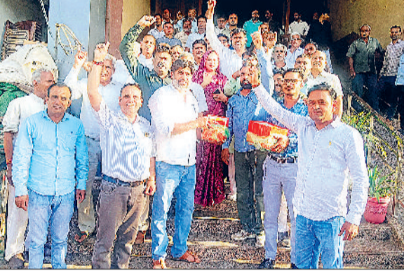
नारनौल। सम्राट चौधरी के सीएम बनने पर लहू बांटे हुए।

अतिरिक्त उपायुक्त ने बताया कि जो बच्चे किसी कारणवश 21 अप्रैल को दवा नहीं खा पाएंगे, उन्हें पांच मई को आयोजित होने वाले विशेष सत्र में यह दवा दी जाएगी। उन्होंने बताया कि मिट्टी से फैलने वाले कीड़ों के संक्रमण से बच्चों के शारीरिक और मानसिक विकास में रूकावट आती है, जिससे उनमें कुपोषण और खून की कमी जैसी समस्याएं हो सकती हैं। कृमि मुक्ति की यह दवा न केवल बच्चों की बीमारियों से लड़ने की शक्ति बढ़ाती है। आंगनबाड़ी केंद्रों और स्कूलों के साथ साथ शहरों में भी विशेष केंद्र बनाकर यह दवा मुफ्त उपलब्ध कराई जाएगी।