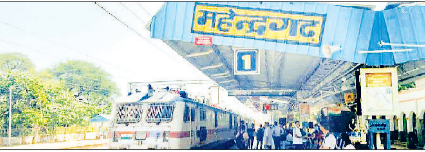
महेन्द्रगढ़। रेलवे स्टेशन।