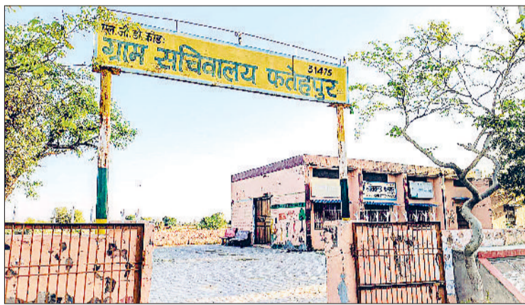
नारनौल। ग्राम पंचायत फतेहपुर।