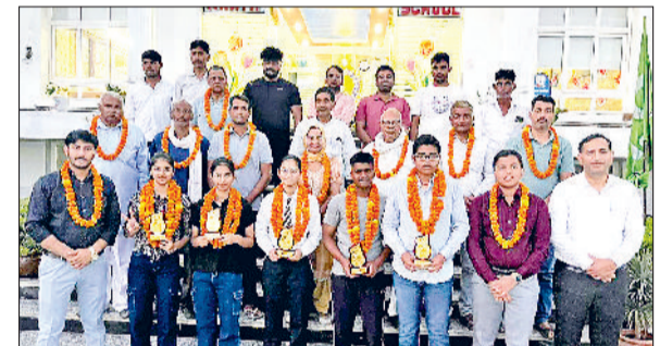
रेवाड़ी। सीबीएसई बोर्ड बोर्ड परीक्षा में श्रेष्ठ प्रदर्शन करने वाले विद्यार्थियों को ट्रॉफी देकर सम्मान करते शिक्षक।

केंद्रीय माध्यमिक शिक्षा बोर्ड (सीबीएसई) के परीक्षा परिणामों में राट इंटरनेशनल स्कूल के विद्यार्थियों ने उत्कृष्ट अंक प्राप्त कर विद्यालय और क्षेत्र का नाम गौरवान्वित किया। इस वर्ष छात्रों ने अनुशासन, लगन और प्रतिभा के बल पर उल्लेखनीय सफलता अर्जित की।