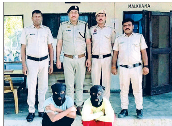
महेन्द्रगढ़। पुलिस गिरफ्त में आरोपित।

मई की तारीख सुरक्षित रखी गई है। सभी अधिकारियों को निर्देश दिए हैं कि हरियाणा पंचायती राज चुनाव नियमों की सख्ती से पालना की जाए और चुनावी प्रक्रिया के दौरान कानून व्यवस्था को प्राथमिकता दी जाए।