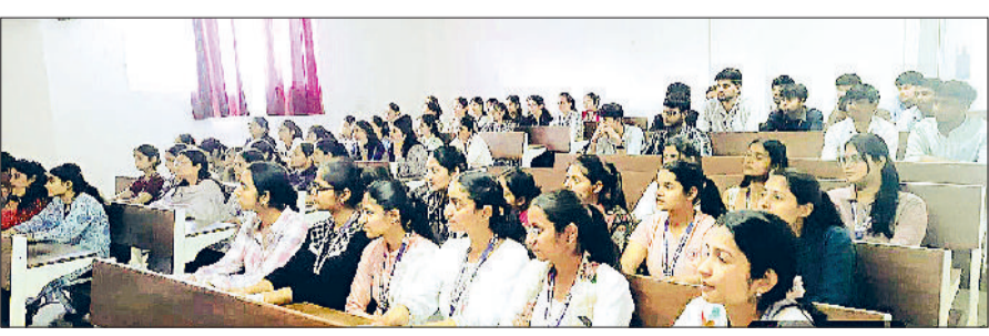
महेन्द्रगढ़। कार्यशाला में उपस्थित विद्यार्थी।